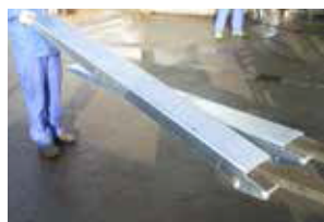
Lever chaque rallonge et la glisser sur la fourche jusqu'à la bloquer derrière le talon.