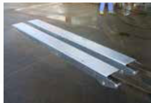
Introduire les fourches dans les rallonges suffisamment pour pouvoir les lever.