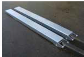
Disposer les rallonges parallèlement au sol.

Installation très rapide, ergonomique et sûre