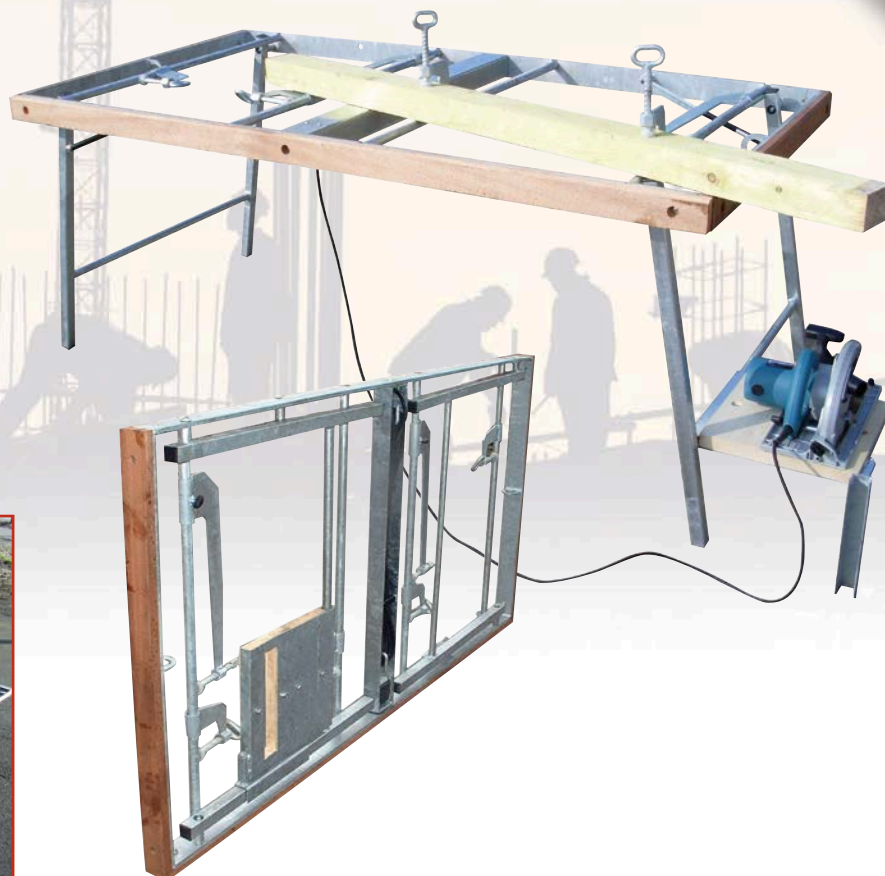
TP 35 GRAND FORMAT