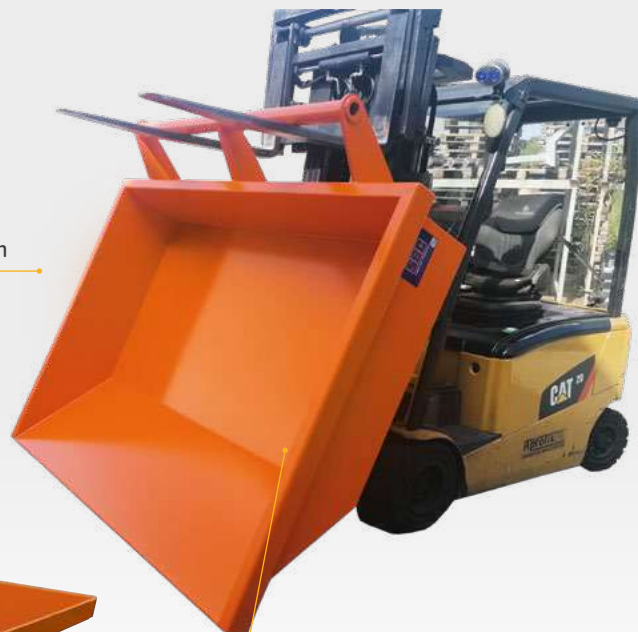
Vidage complet au sol