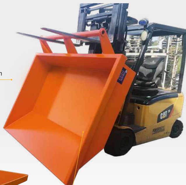
Vidage complet au sol