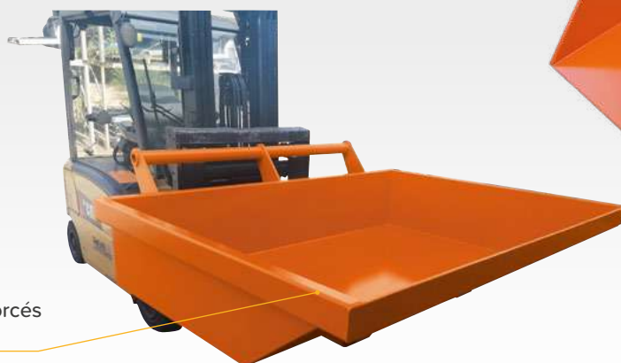
Bords de cuve renforcés par UPN