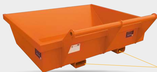
Fourreaux ép. 10 mm