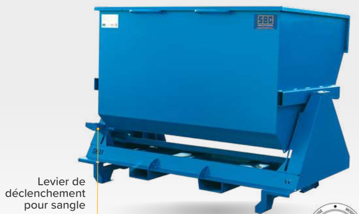
Levier de déclenchement pour sangle