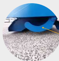
Déclenchement automatique par contact