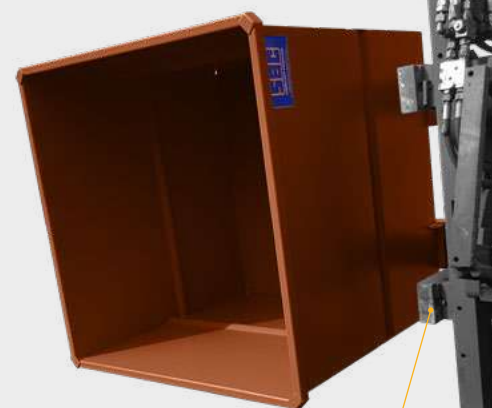
Vidage par chariot équipé de tête rotative