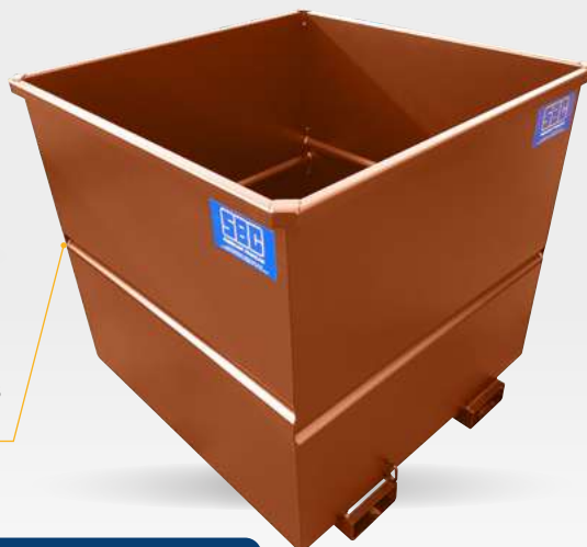
Cuve renforcée par nervures embouties