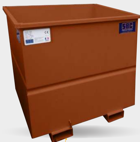
Fourreaux soudés sous la cuve