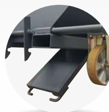
Trappe à fond ouvrant