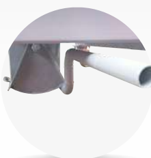
Trappe à casque