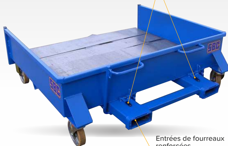
Entrées de fourreaux renforcées