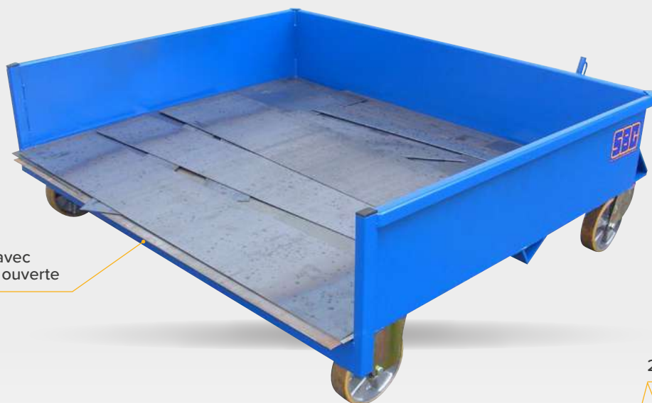
Fond plat avec face avant ouverte