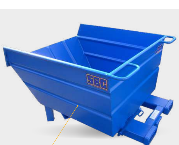
Cuve renforcée par nervures embouties