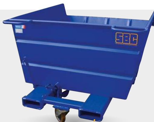
Entrées de fourreaux renforcées