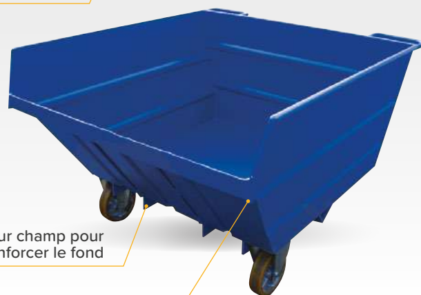
Plats sur champ pour renforcer le fond