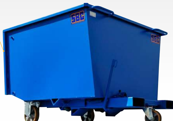
Face avant renforcée par tube rectangulaire