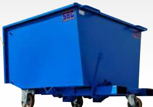
Face avant renforcée par tube rectangulaire