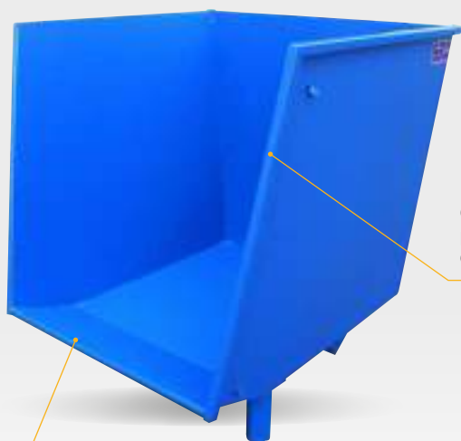
Fond relevé sur l'avant