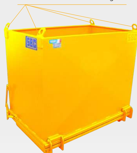
TP50 O avec oreilles de levage