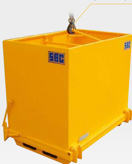
TP50 P avec palonnier pour grue