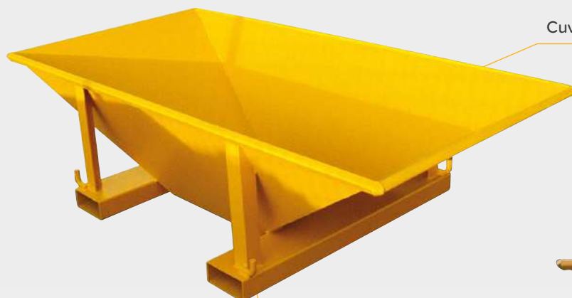
Cuve mécano-soudée ép. 4mm