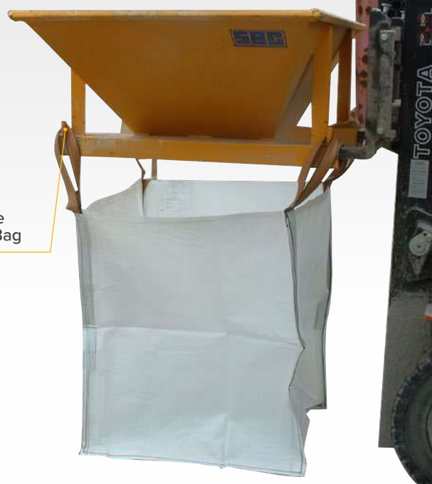
Ronds d'accrochage pour anses de Big Bag