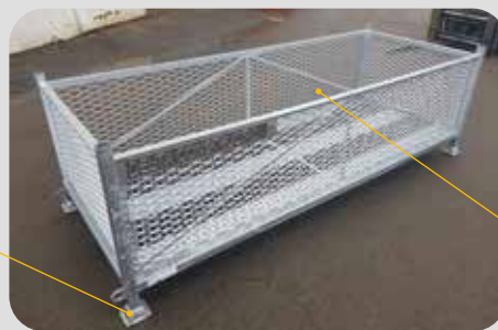
Coupelles de gerbage monoblocs