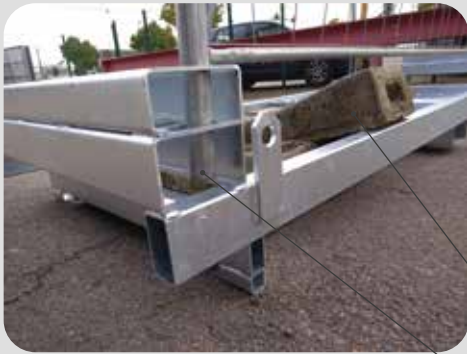
les plots passent sous les clôtures et sont calés dans le bloc inférieur