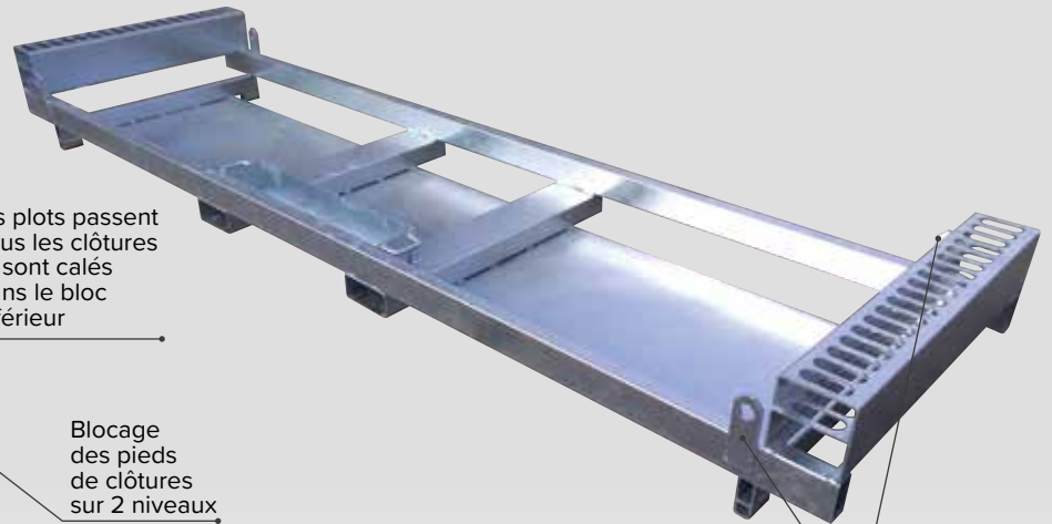
Oreilles de levage