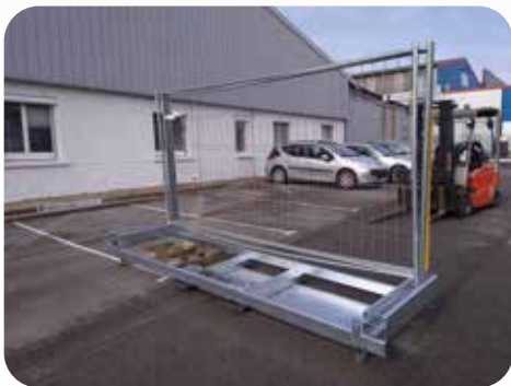
Plancher en tôle 3 mm renforcé par 2 cornières sur toute la longueur