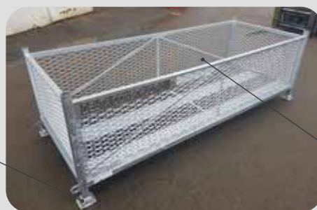
Coupelles de gerbage monoblocs