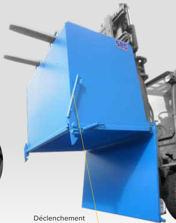
Déclenchement par levier manuel