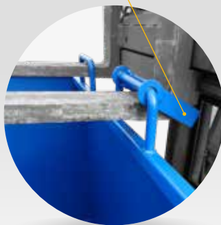
Charnière déportée : ouverture totale du fond