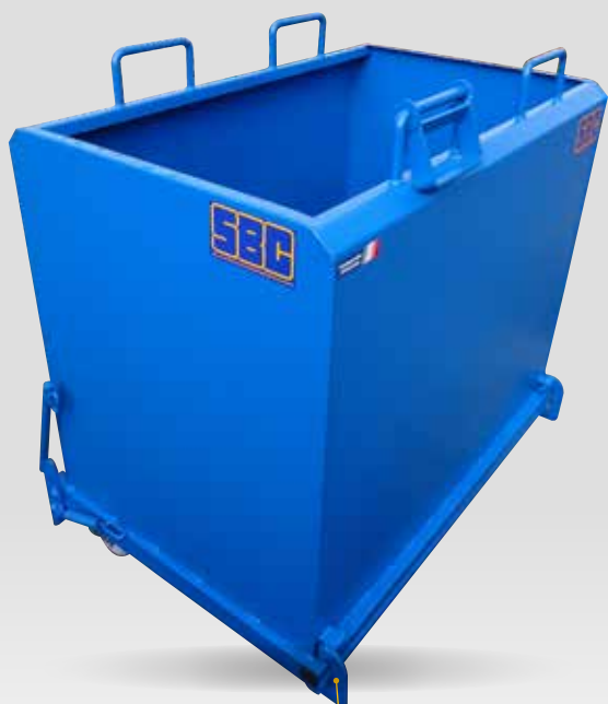
Verrouillage sur une fourche