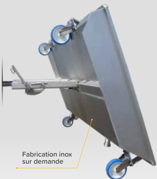
Fabrication inox sur demande