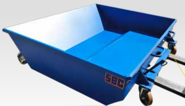
Cuve surbaissée, optimisation du volume