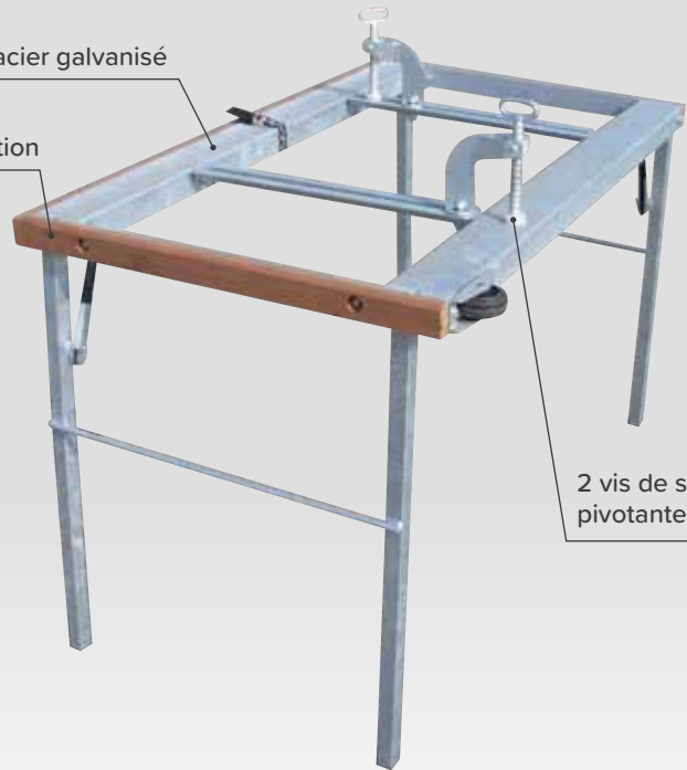
2 vis de serrage pivotantes à 360°