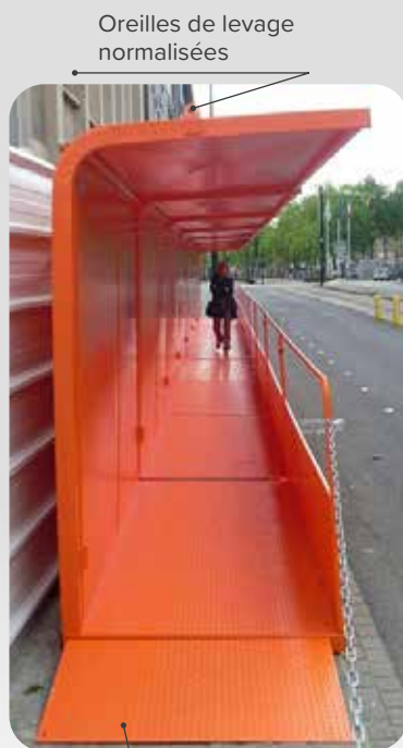
Oreilles de levage normalisées