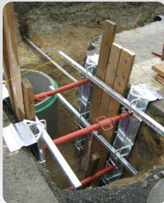
Barre de maintien du boisage