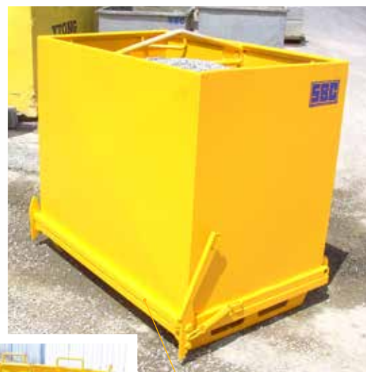
TP50 P avec palonnier pour grue