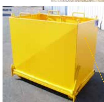
TP50 E avec étriers pour chariot élévateur