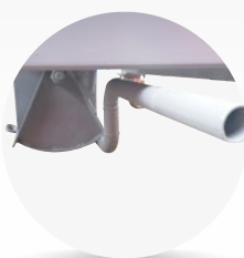
Trappe à casque