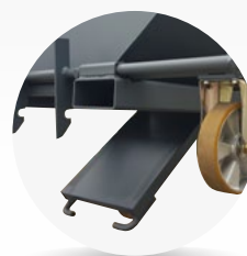
Trappe à fond ouvrant