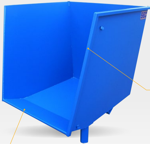
Fond relevé sur l'avant