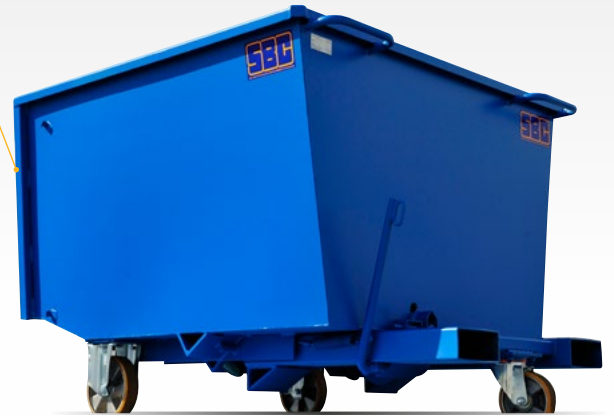
Face avant renforcée par tube rectangulaire