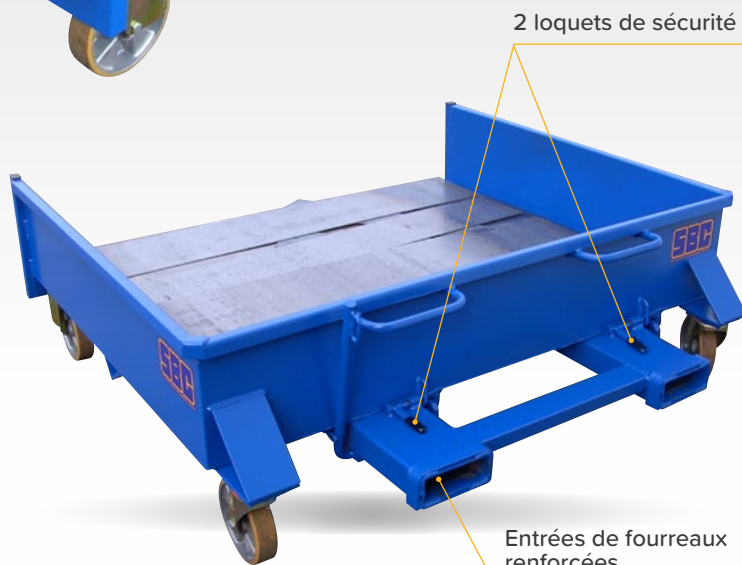
2 loquets de sécurité