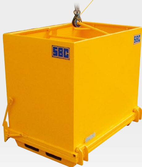
TP50 P avec palonnier pour grue