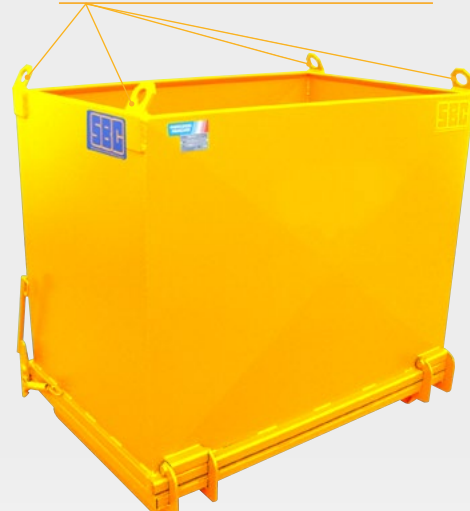
TP50 O avec oreilles de levage