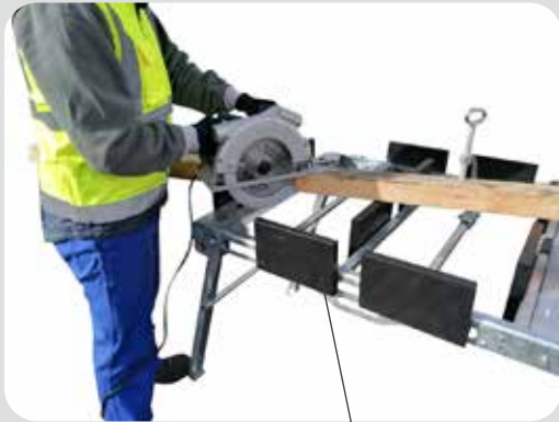
18 martyrs hauts en PEHD recyclés

Table destinée à la découpe de bastinges, planches et panneaux de grandes dimensions sur les chantiers de construction.